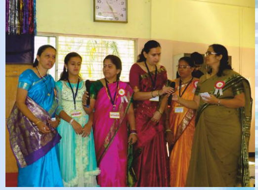
संमेलनात स्वागतगीत सादर करताना नाशिक मधील महिला कार्यकर्त्या