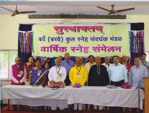
सन २०१६-२०१९ करितां नियुक्त नवीन कार्यकारी मंडळ