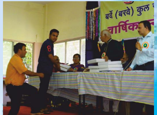
नाशिक मधील कार्यकर्त्यांचा सत्कार