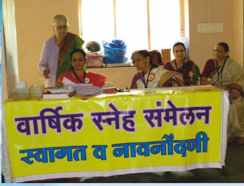
(१) स्वागत व नांव नोदणी